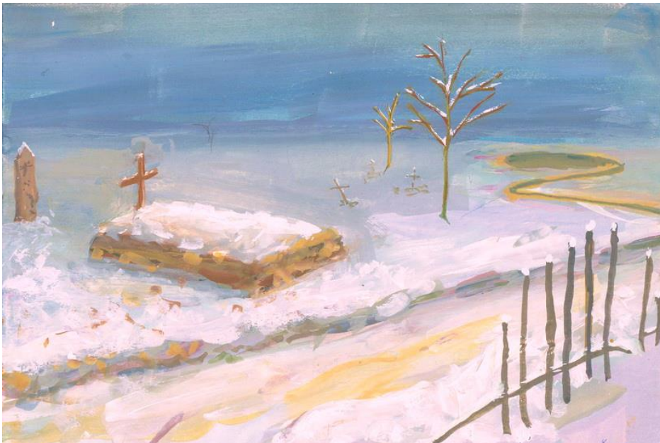
Рад Кристине Шулкић

2. Наставник позива ученике на потпуну тишину. Започиње откуцавање часовника (у пауер поинт презентацији) које ће трајати до краја часа. У циљу постављања визуелног „рама приче“ описујемо пејзаж с почетка приповедања. На видео биму пројектујемо слику (рад ученика) којом је дочаран приказ, описан на почетку приповедања, који се види кроз прозор манастирске ћелије. (слајд 4)